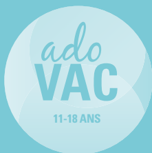
TABLEAU DES VACCINATIONS RECOMMANDÉES CHEZ L'ADOLESCENT 1